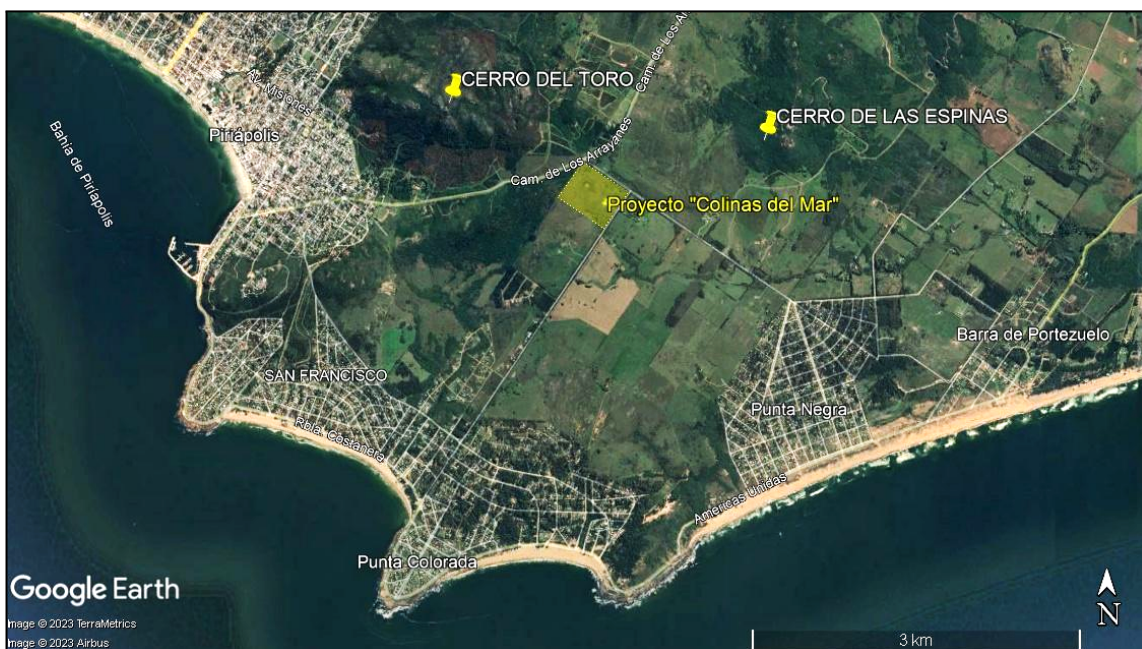
Imagen 1. Zona del Proyecto “Colinas del Mar”, padrones rurales N° 31960, 31969, y 31970, tercera sección catastral, Punta Colorada, departamento de Maldonado.

Para poder llevar adelante el proyecto de urbanización, es necesario cambiar la categorización del suelo, de rural potencialmente transformable a urbano . La Intendencia Departamental de Maldonado es responsable de evaluar el PAI que presentaron los particulares e implementar los mecanismos de participación ciudadana que incluyan las apreciaciones de la sociedad civil, en cumplimiento de la ley N° 18308 Ley de Ordenamiento Territorial y Desarrollo Sostenible.